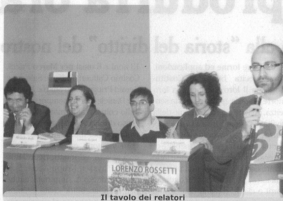
Il tavolo dei relatori