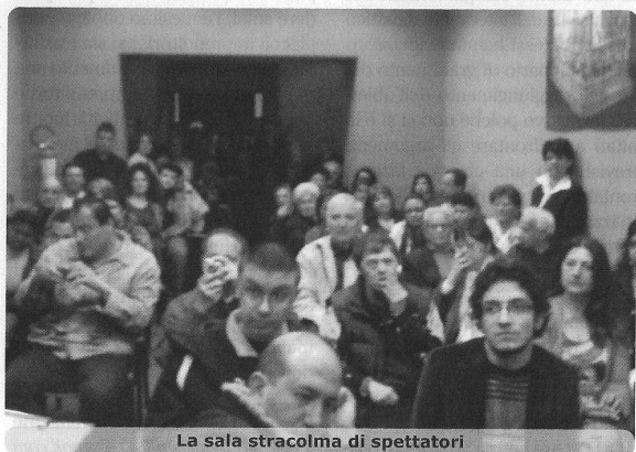
La sala stracolma di spettatori

pazione, poiché era l'unica sala in cui i disabili sarebbero potuti arrivare senza problemi, normalmente, come tutti gli altri. Per concludere non resta che invitare tutti a leggere il libro di Lorenzo Rossetti, un libro semplice ma denso di contenuti forti che può aiutare tutti, disabili e non, ad andare "Oltre l'ostacolo".